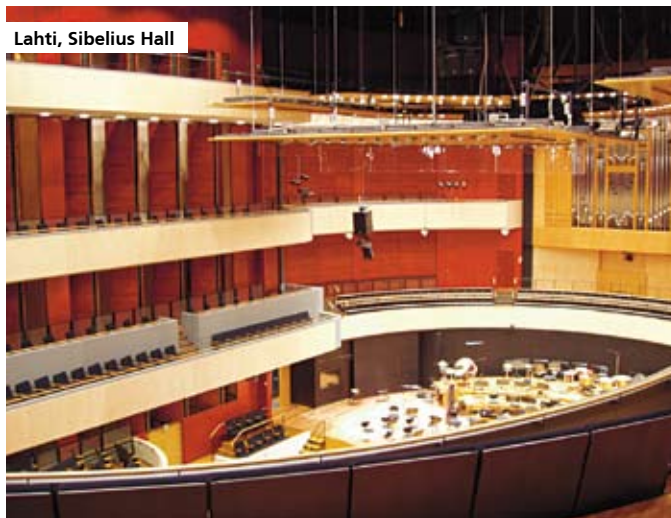
Lahti, Sibelius Hall